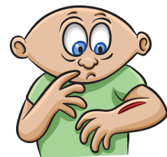
Infecciones o lesiones tardan más de lo usual en sanar

Para más información, visite Cornerstones4Care.com