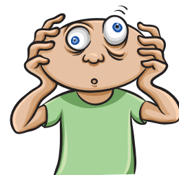
Mareo o temblores