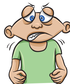
Nervioso o alterado

Si el nivel bajo de azúcar en la sangre no se trata, puede convertirse en severo y causarle un desmayo. Si usted tiene un problema de nivel bajo de azúcar en la sangre, hable con su médico o su equipo para el cuidado de la diabetes.