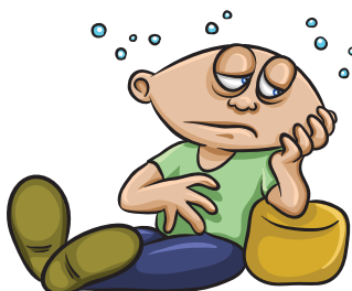
Debilidad o cansancio